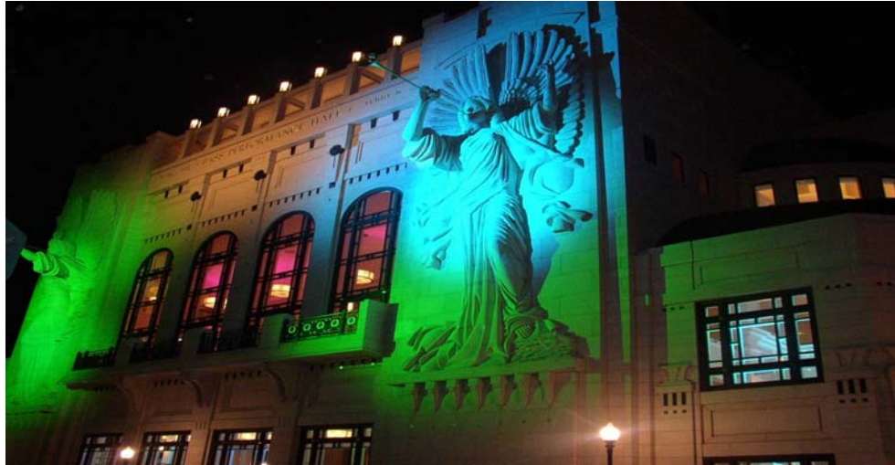
Bass Performance Hall Fort Worth