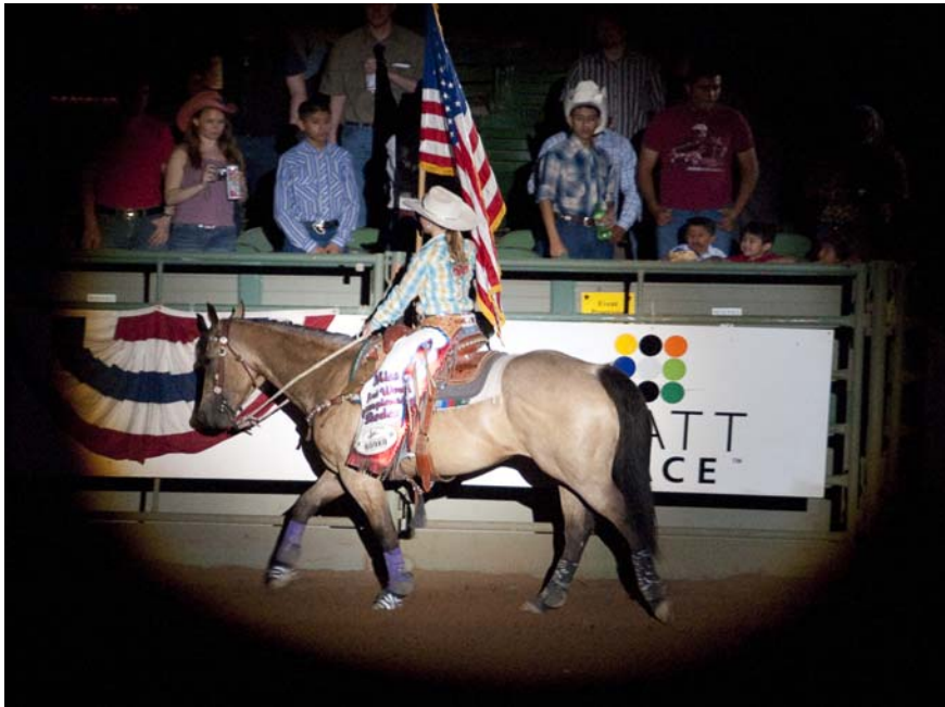
Rodeo Fort Worth Stockyards - Pictures taken by Manja van de Plasse

Club Mission Statement: The charter of the Holland-America Club is to provide social and recreational activities for their members, encouraging the preservation of the Dutch heritage. The Holland-America Club of Dallas, was founded on October 3, 1973, as a non-profit organization. For further information on the club, visit us at www.hollandamericaclub.com .