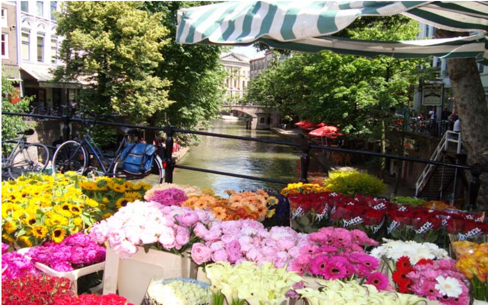
Bloemenstal in Utrecht

Club Mission Statement: The charter of the Holland-America Club is to provide social and recreational activities for their members, encouraging the preservation of the Dutch heritage. The Holland-America Club of Dallas, was founded on October 3, 1973, as a non-profit organization. For further information on the club, visit us at www.hollandamericaclub.com .